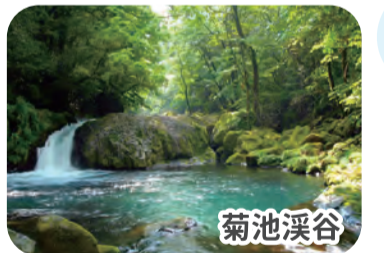
熊本県の名水はすべてそのまま飲むことができます！

実は名水百選に選ばれている水は「そのまま飲める美味しい水」だと思われがちですが、実は煮沸しないと飲めない・まったく飲めない水もあります。その理由は、名水百選における名水が「保全状況が良好」で「地域住民等による保全活動がある」という基準で選ばれており、「そのまま飲める美味しい水」という意味ではないからです。なんと名水百選の約3割がそのまま飲むことができません。ちなみに熊本県の名水はすべて、そのまま飲むことができる美味しい水であると認定されています。