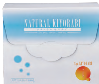
水素入浴剤スパキヨラビ ナチュラルキヨラビ