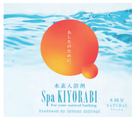
水素入浴剤スパキヨラビ(ナチュラル)