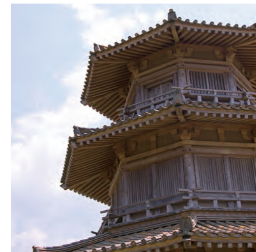
鞠智城のシンボル、八角形鼓楼

周囲の長さは3.5キロメートル、面積は55ヘクタールの規模を持つ鞠智城は九州を統治していた太宰府やそれを守るための城に武器や食糧を送る基地の役割を果たしていたと考えられています。また、国内の古代山城ではとても珍しい八角形建物跡が4基見つかったっており、「八角形鼓楼」として復元され、鞠智城跡のシンボルとしてその姿を残しています。鞠智城の魅力はなんといっても、その佇まい。まるで古の日本に迷い込んだような、不思議な感覚を味わうことができます。