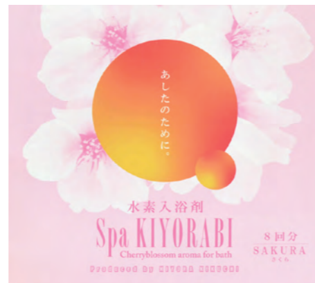
水素入浴剤スパキヨラビ(さくら)