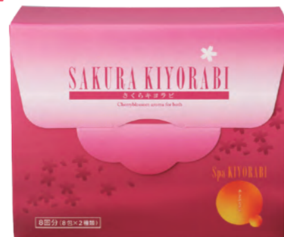
水素入浴剤スパキヨラビ さくらキヨラビ