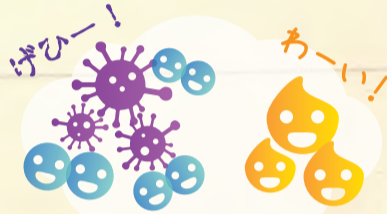
悪玉活性酸素のみを還元!

水素はカラダの中の悪玉活性酸素のみを選択的に還元します。そもそも水素は強い還元力を持っていないため、酸化力が弱い善玉活性酸素とは結びつきません。しかし、悪玉活性酸素は酸化力が非常に強いので、自ら水素と結びつきます。この絶妙な還元力が水素の魅力のひとつです。