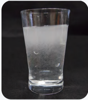
水素濃度1.6ppmを超えた過飽和水素水のキョラビ

メーカーの多くは水に水素を溶かし込むときに「圧力」をかけます（キョラビもその製法です）。そして、実際に圧力をかけて水素を溶かし込んでいる最中は、2.0ppmを超えたり、それ以上になるのは普通です。右の画像はパッケージに充填される前のキョラビ。この時点の水素濃度は1.6ppmを超えています。数秒後には1.6ppmに戻ってしまいます。全ての水素水は、充填時には水素濃度1.6ppmにまで下がっていると考えると間違いありません。