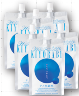
ナノ水素水キヨラビ(500ml)6本

商品をご購入された際に付与されるポイントが、180ポイント貯まったお客様へ「ナノ水素水キヨラビ(500ml)6本」をプレゼントしておりましたが、7月から、180ポイントに達した際に、そのご購入金額より2,160円(キヨラビ500ml6本分)割引させていただくこととなりました。