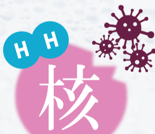
水素は“核”を活性酸素から守ることができる

活性酸素はカラダの細胞の中の“核”を傷つけます。“核”の中にはカラダの設計図であるDNAがあり、これが酸化することで遺伝情報が乱れ、細胞・組織の機能低下が起こり、最後は病気や老化へと繋がります。多くの抗酸化物質は“核”の中まで到達できず、活性酸素からの害からカラダを守ることが難しいですが、水素は“核”の中まで到達することができます。そのため、水素は“核”を活性酸素から守ることができる抗酸化物質であると期待されているのです。