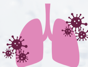
呼吸で取り入れた空気の約2%が活性酸素に...

呼吸で取り入れた空気の約2%が活性酸素へと変化します。つまり、どれだけ健康に気を遣った生活を心がけていても活性酸素からは逃れられないのです。他にも運動やストレスなど、避けられないようなことが原因となって活性酸素は発生しますので、活性酸素を増やさない努力も大事ですが、活性酸素をできるだけ減らす努力が重要となってきます。